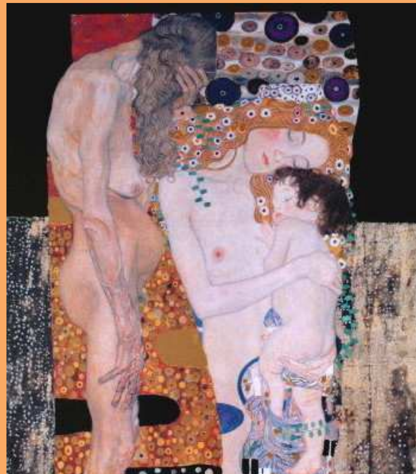
Les trois âges - Gustav KLIMT

Enseignements issus de la pratique auprès de femmes toxicomanes